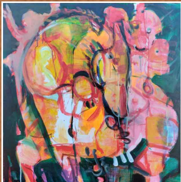
Акрил/уље на платну 100x100