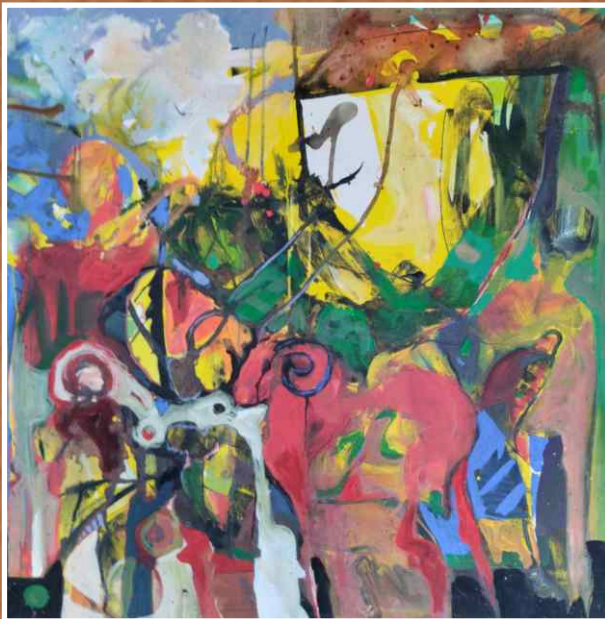
Акрил/уље на платну 100x100