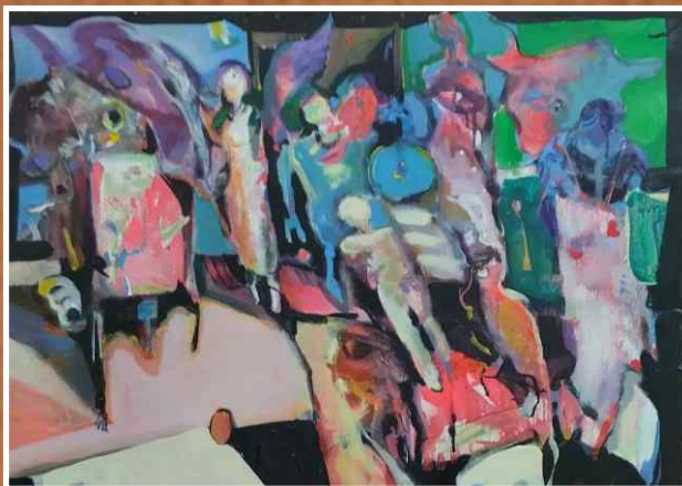
Акрил/уље на платну 80x60