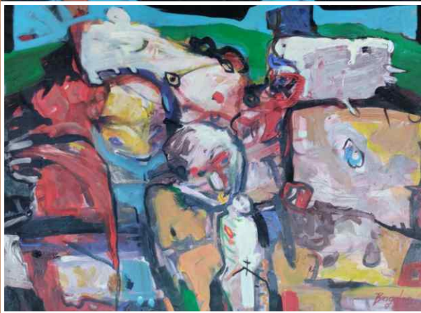
Акрил/уље на папиру 80x60