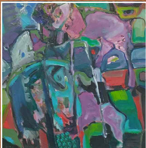
Акрил/уље на платну 70x70