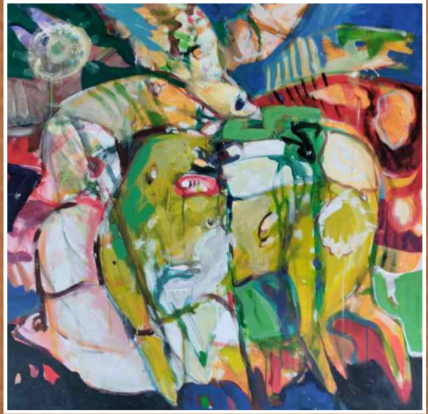
Акрил/уље на платну 100x100