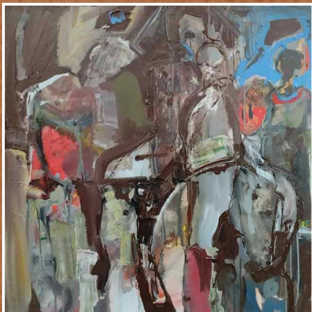
Акрил/уље на платну 70x70