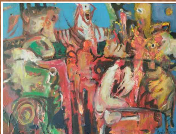
Акрил/уље на платну 80x60