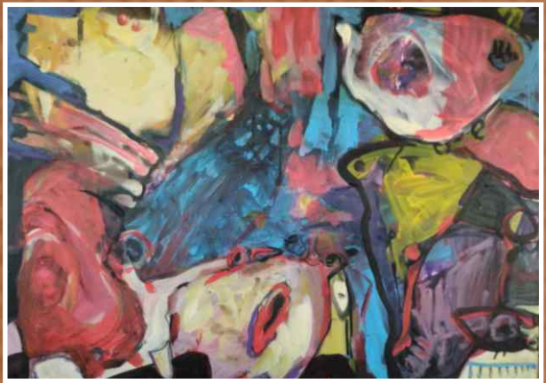
Акрил/уље на платну 80x60