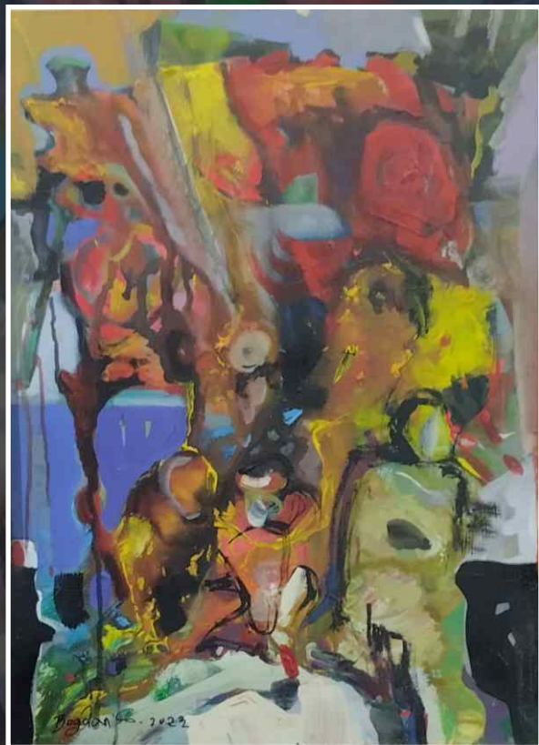
Акрил/уље на платну 70x50