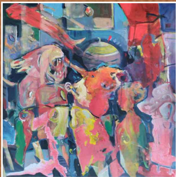
Акрил/уље на платну 100x100