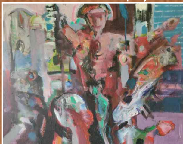
Акрил/уље на платну 90x70