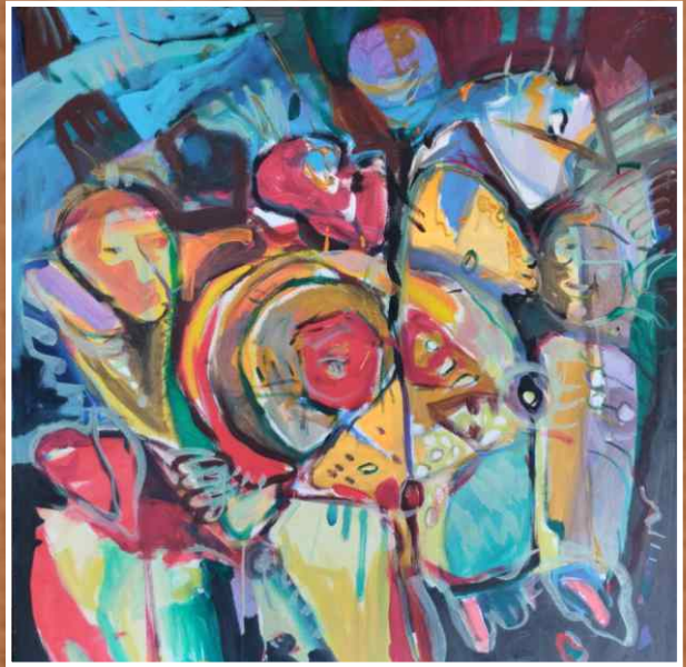
Акрил/уље на платну 100x100