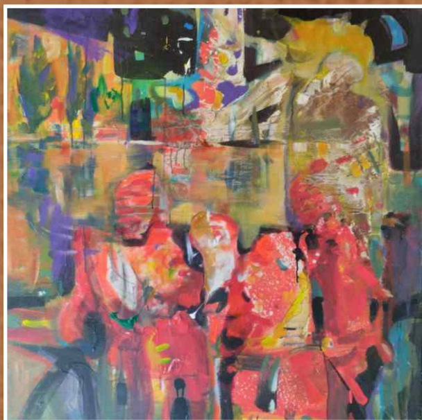
Акрил/уље на платну 100x100