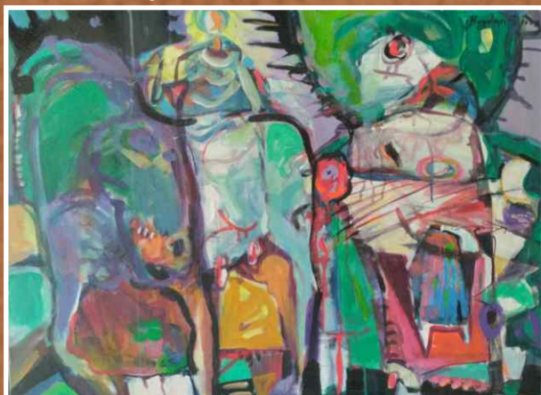
Акрил/уље на платну 80x60