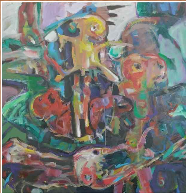
Акрил/уље на платну 100x100