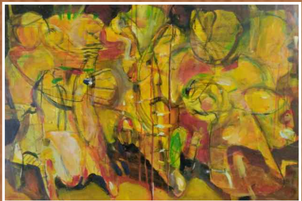
Акрил/уље на папиру 100x70