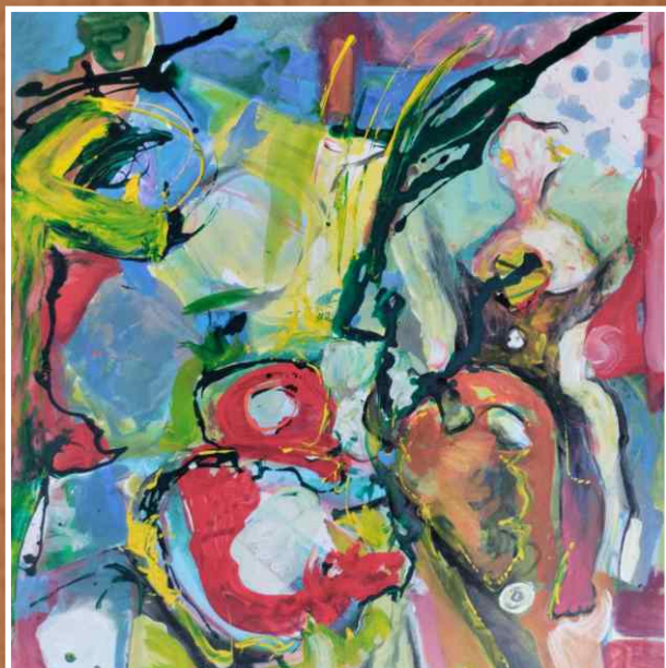
Акрил/уље на платну 100x100